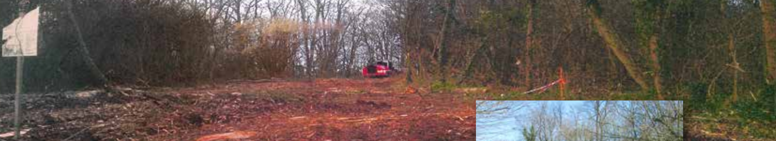
Défrichage du Bois des Fours à Chaux

et de nouveau que nous vous proposerons des réponses à ces attentes. L'idée ? Eviter que des habitants du village se réveillent, comme cela est arrivé et arrive encore aujourd'hui, avec des terrains retournés, des voies de circulation modifiées, des bois défrichés, sans connaître la teneur de décisions prises en dépit de leurs intérêts.