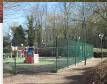
Parc de l'Harmonie

et de nouveau que nous vous proposerons des réponses à ces attentes. L'idée ? Eviter que des habitants du village se réveillent, comme cela est arrivé et arrive encore aujourd'hui, avec des terrains retournés, des voies de circulation modifiées, des bois défrichés, sans connaître la teneur de décisions prises en dépit de leurs intérêts.