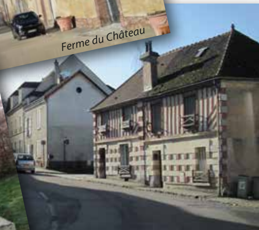
Rue de Paris