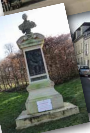
Monument Louis Braille