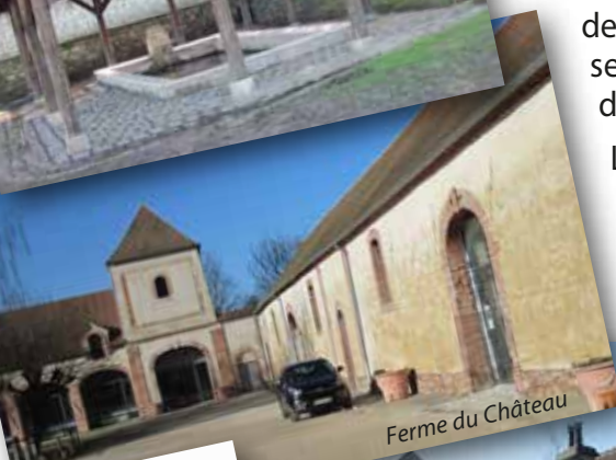
Ferme du Château

Afin de trouver un juste équilibre entre besoin d'évolution et nécessité de préservation du cadre actuel, construisons ensemble un projet collectif. C'est dans ce souci de lien social, de transparence